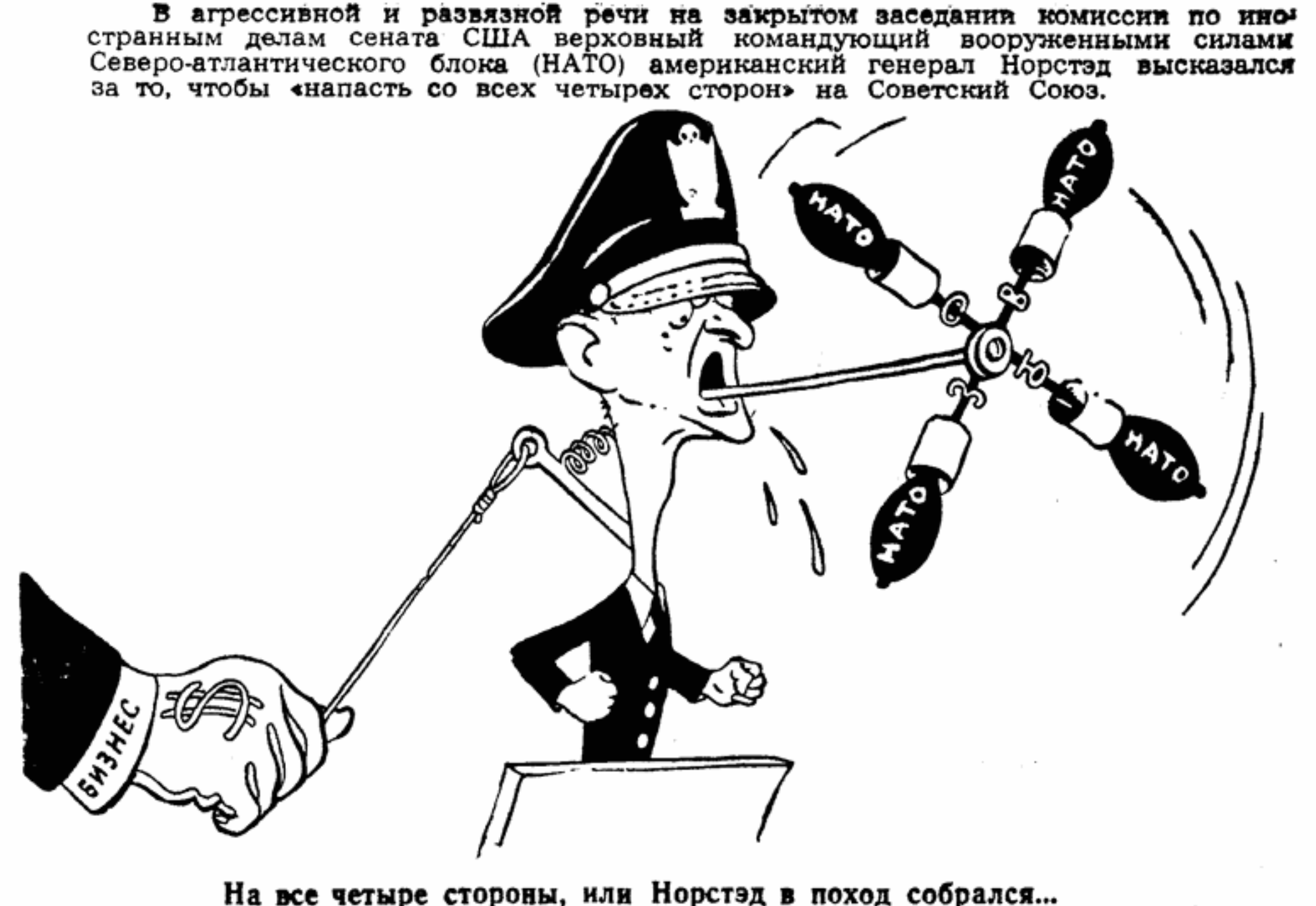
На все четыре стороны, или Норстэд в поход собрался... Рисунок Бор. Ефимова

Пахнут руки польноью. Под тенью раки я лежу. Где-то птица поет надо мной. Это птица поет или сердце звенит мне с зарей! Пробудилась земля, сон согнала, обещала мне чудный день. Пахнут руки мои земляники лесной, ее кровь у меня на руках, на губах. Я по вырубке шел, и дышал летний зной мне в лицо ароматом деревьев и трав. Я упал на траву, поглотило меня ликование дня. Пахнут руки сосной. Прядо мной косогор. Я бежал. Я хватался за те же стволы, что стояли и в прошлом году. Я за серной бегу, пью дышанье смоляное. Как дикий, ослепленный травой и листвою, прибежал я к деревне тропинкой лесной. И еще на руках чудный запах храню: я под яблоней встретил подругу мою. Перевела М. ПАВЛОВА