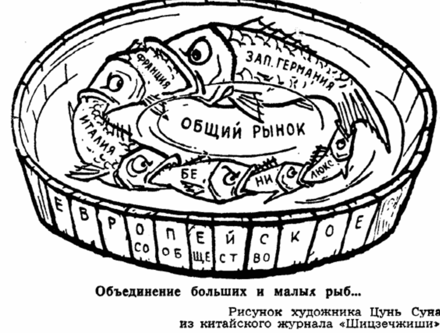
Объединение больших и малых рыб... Рисунок художника Цунь Суя из китайского журнала «Шизчизизи»

«Хочешь мира, готовься к войне». Это очень мило, хотя и несомненно старомодно. Корреспонденция написана в дни недавнего правительственного кризиса. — Прим. ред.