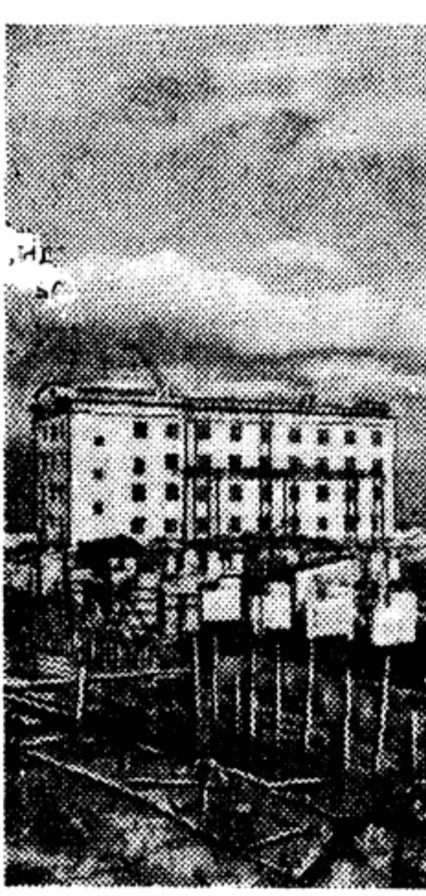
Общий вид строительства Васильевской государственной районной электростанции.

В. ЮРЕВИЧ , корреспондент «Литературной газеты» Минск